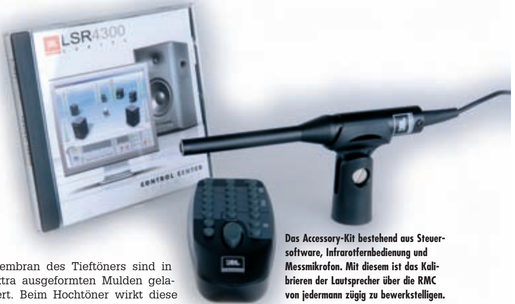
Das Accessory-Kit bestehend aus Steuer- software, Infrarotfernbedienung und Messmikrofon. Mit diesem ist das Kalibrieren der Lautsprecher über die RMC von jedermann zügig zu bewerkstelligen.

Die vielen Anschlussbuchsen und Schalter auf der Rückseite sollten Sie nicht abschrecken. Ihre Funktion erschließt sich beinahe von selbst, außerdem ist das (englischsprachige) Handbuch ein guter Leitfaden, da es übersichtlich gegliedert und verständlich verfasst ist. Dennoch kurz die Rückseite im Überblick: