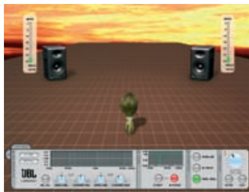
Über den Equalizer (links unten im Bild) der Control Center-Software sind Feineinstellungen des Klanges möglich.

Auffällig ist eine ganz leichte Präsenz der Lautsprecher im Bereich oberhalb 2 kHz. Solange nur Pop- oder Rockmusik abgehört wird, fällt dies nicht auf. Bei akustischem, sparsam instrumentiertem Jazz oder auch klassischer Musik macht sich dies deutlicher bemerkbar: Der Ton eines Flügels wirkt gläserner, eine mit ausgereifter klassischer Technik gespielte Konzertgitarre klingt schärfer, Stimmen werden ein wenig heiser. Gerade bei schnellen, eher perkussiven Impulsen (Klavier, Gitarre) werden die Mitten, die den Ton erst rund machen, von den präsenten Höhen etwas überdeckt. Allerdings fällt dies wirklich nur im direkten Vergleich mit Dynaudios AIR 6 auf, deren Wiedergabe insoweit hervorragend ist. Hier hilft ebenfalls die Steuer-Software. Unterm Stich bringen die JBL